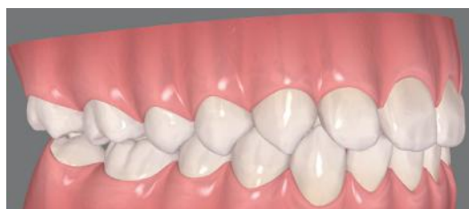
Abb. 3 - 15 Monate später: Perfekte Verzahnung

Buchen Sie Ihren Termin bei uns bequem online!