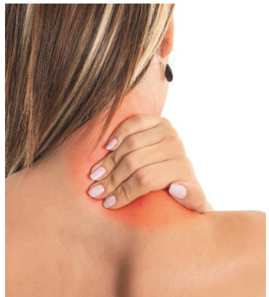
Nackenverspannungen können durch Zahnfehlstellungen verursacht werden.